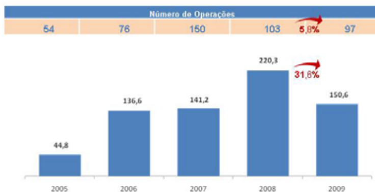
Total - Montante e Nº de Operações - R$ bilhões (Bloco 1 + Bloco 2) - Anúncio

Considerando apenas as transações de Fusões & Aquisições, a redução foi de 34,3% em volume e de 5,4% em número de operações, sendo R$ 136,1 bilhões e 88 operações contra R$ 207 bilhões e 93 operações, nos anos de 2009 e 2008 respectivamente. Excluindo-se o deal de R$ 106,0 bi de Itaú-Unibanco, o volume teria crescido em 34,8%. Com relação às OPAs e Reestruturação Societária, houve menos operações realizadas, nove em 2009 contra dez em 2008, porém o volume negociado cresceu 9%, passando de R$ 13,3 bilhões para R$ 14,5 bilhões no último ano.