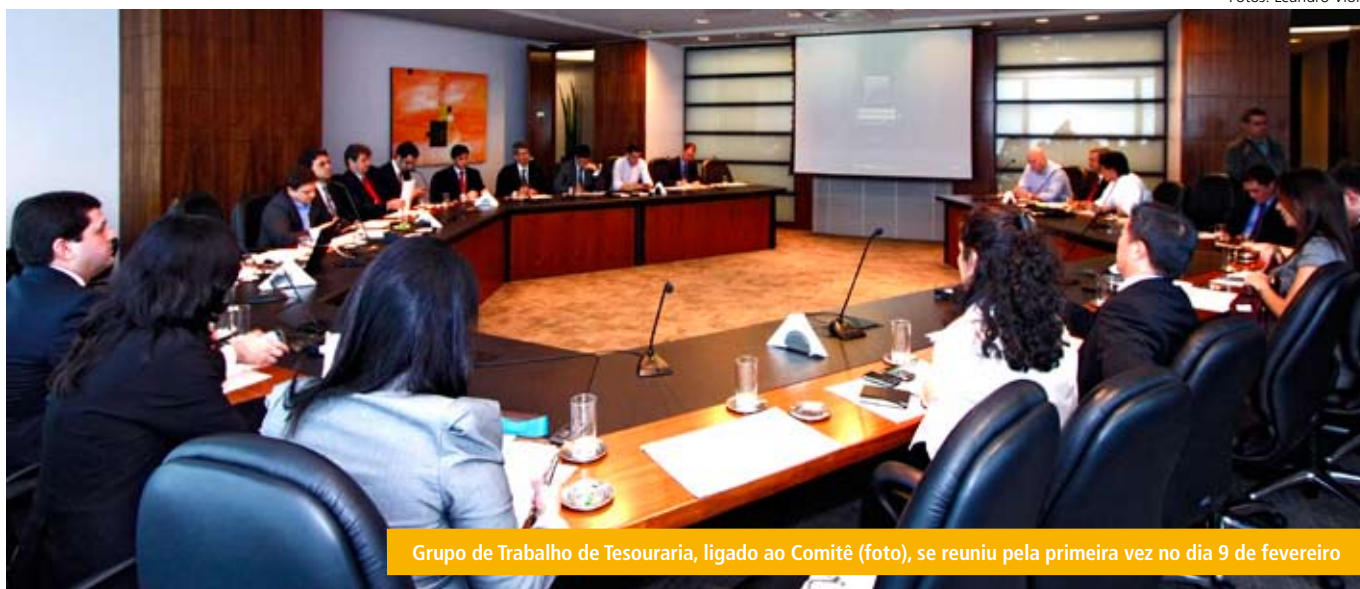
Grupo de Trabalho de Tesouraria, ligado ao Comitê (foto), se reuniu pela primeira vez no dia 9 de fevereiro