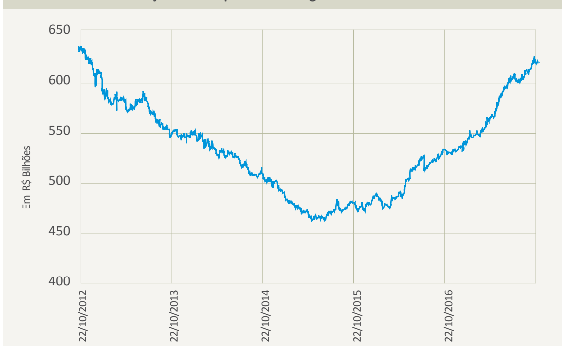
Gráfico 1. Evolução do estoque de CDBs registrados na B3 S.A. – 2012 a 2017

Fonte: B3 S.A. Dados de outubro de 2012 a outubro de 2017. Elaboração do autor.